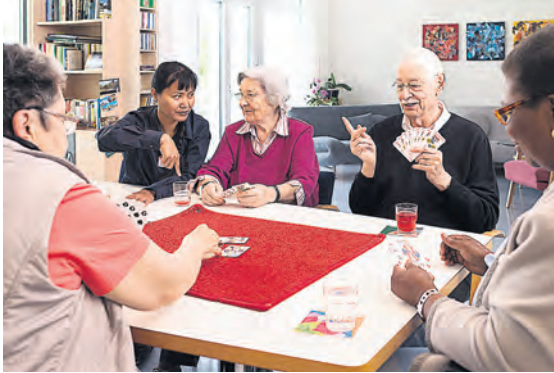
Alterszentrum Alenia, Worbstr. 296, Gümligen Weitere Informationen finden sie auf: www.alenia.ch/tagestreff

bietet genau diese Unterstützung. Der Tagestreff steht allen offen, die zwar zuhause leben, aber im Alltag auf Betreuung angewiesen sind. Qualifiziertes Personal kümmert sich von Montag bis Freitag um die Tagesgäste. Zu den Leistungen gehören die Betreuung, Verpflegung und die Teilnahme an den Aktivitäten und Angeboten des Hauses. So erhalten die Tagesgäste einen geregelten Tagesablauf und die Angehörigen einen Freiraum für persönliche Bedürfnisse.